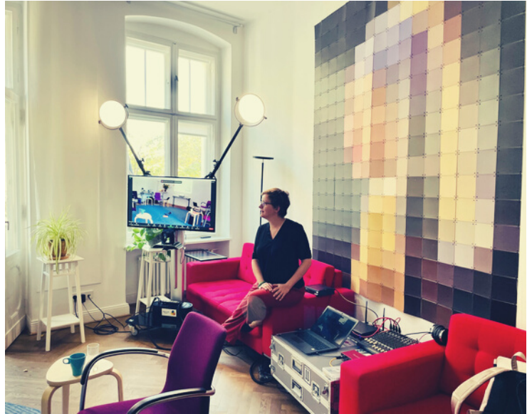
Unsere Coachingausbildung findet hauptsächlich in den Räumen des meet West, Konstanzer Str. 15, 10707 Berlin statt.